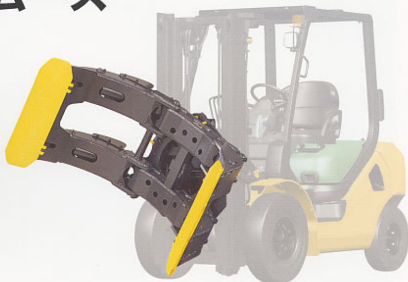
写真はロールクランプ・一体式・シングルスイング式

性能、装備、特に視界、外観等については機種及びマスト、アタッチメントのタイプ、仕様により異なりますので、必ず最寄りの小松リフト販売店へ御相談ください。