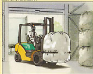
フォーククランプ