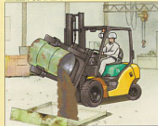
回転フォーククランプ・ドラムアダプター付