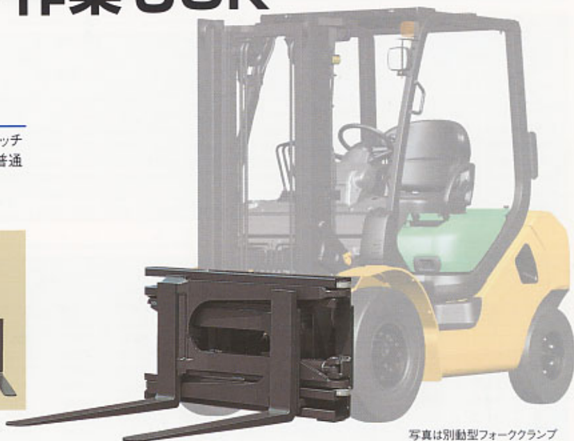
写真は別動型フォーククランプ