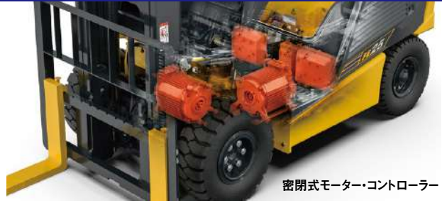
密閉式モーター・コントローラー

約760haの自社林を有し、伐採から植林まで手掛けカーボンニュートラルに向け取り組んでいます。これからはフォークリフトも、排ガスのないバッテリー車へさらに代わっていくと思います。