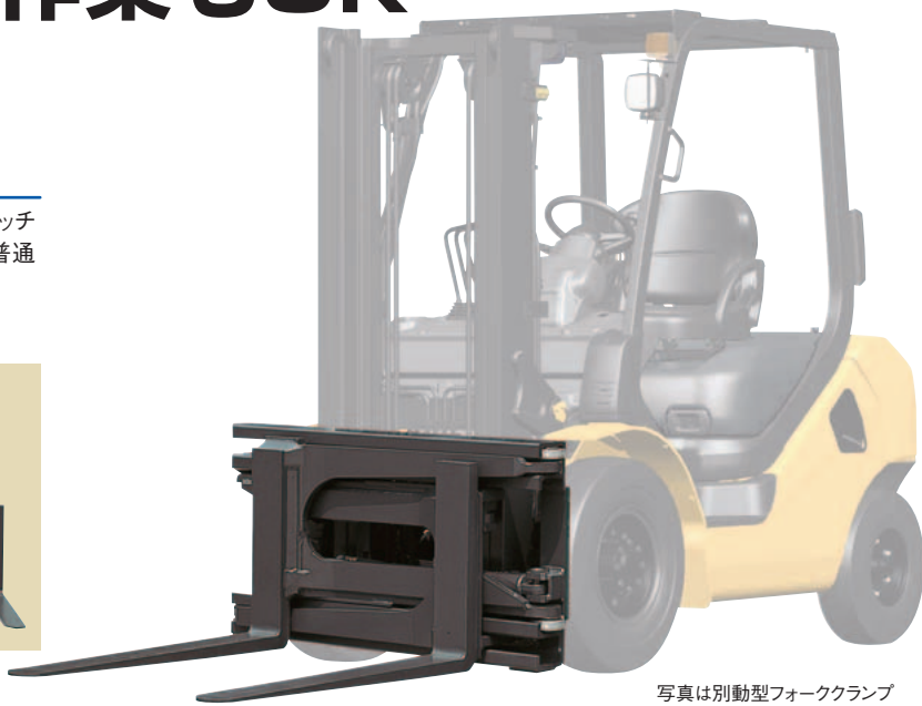
写真は別動型フォーククランプ