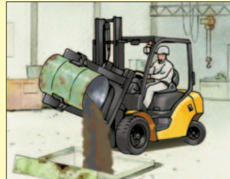
回転フォーククランプ・ドラムアダプター付