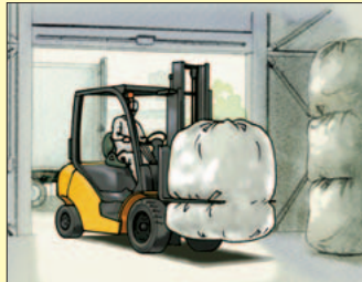
フォーククランプ